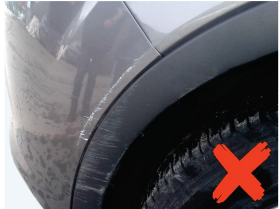
Damage on the side of a bumper cover (no other exterior panel needs repainting)