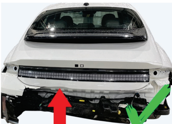
Damage on a small portion of an exterior panel with a separation moulding (exceptional case)