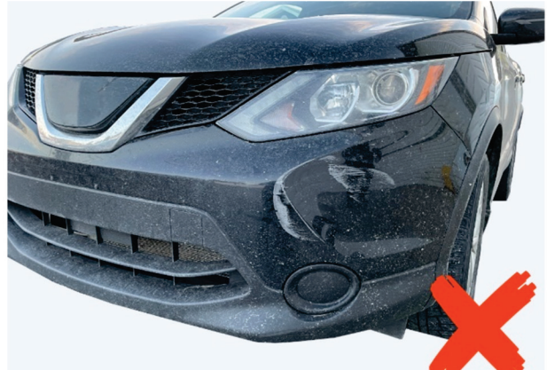
Damage on the front corner of a bumper cover (located on the front side)