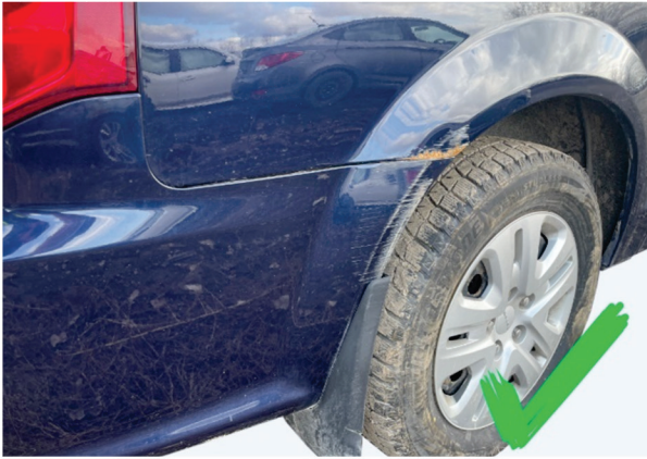
Damage on the side of a bumper cover and on an exterior panel